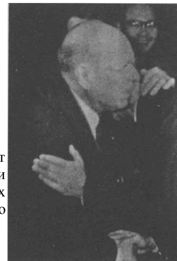
блго Казальс обнимает доктора Судзуки после выступления юных музыкантов в Токио